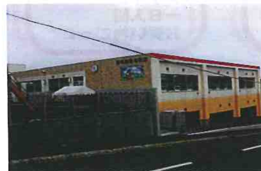
カトリック坂に面しています