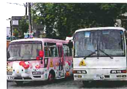
2台のバスで送迎します

学校法人旭川カトリック学園 留萌聖園幼稚園 留萌市宮園町1丁目 電話 0164-42-1600 FAX 0164-43-5123