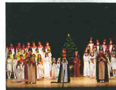
クリスマス会・聖劇